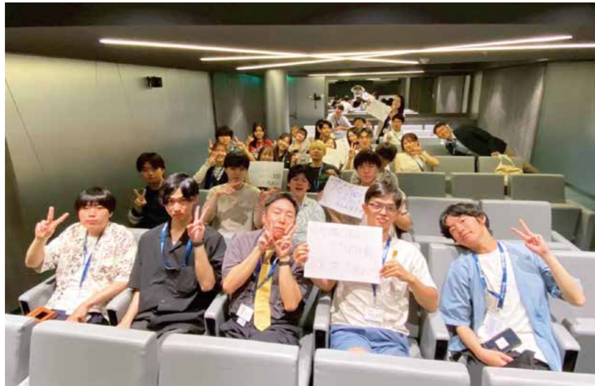
発表を終えた学生たち

授業内で山崎氏が利用した講義資料はスマートクルーズアカデミーにも共有し、今回乗船した学生たちがキャッチコピーを考案するための参考資料となった。